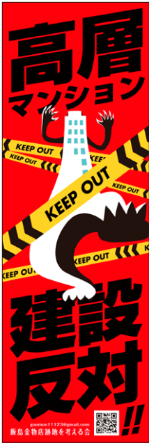
B ハイライズ・モンスター 「KEEP OUT」