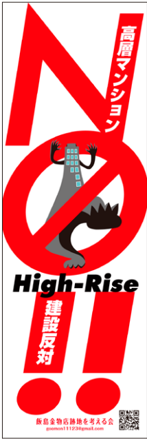
A ハイライズ・モンスター 「NO!! High-Rise」

【Mサイズ】 60 x 180cm:3,000円(ポール&台座セット) 【Lサイズ】 90 x 270cm:4,500円(ポール&台座セット) ※全て消費税込み価格