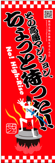
D ゴエモン大釜 「ちよつと待った!!」