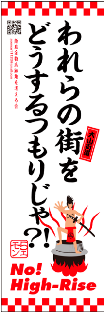
C ゴエモン大釜 「われらの街」